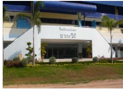
อาคารชาตะวชิร