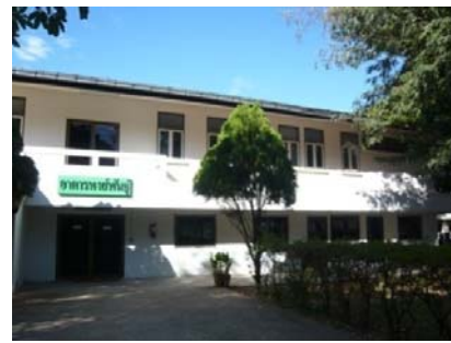
อาคารหงส์พันธุ์