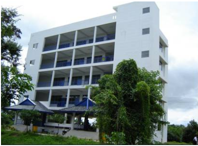
หอพักครู