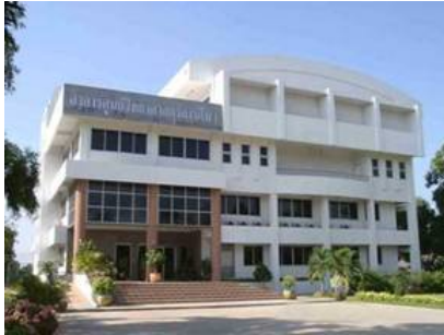
อาคารศูนย์วิทยาศาสตร์การกีฬา