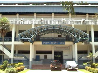
โรงฝึกพลศึกษา สมรักษ์-วิชัย