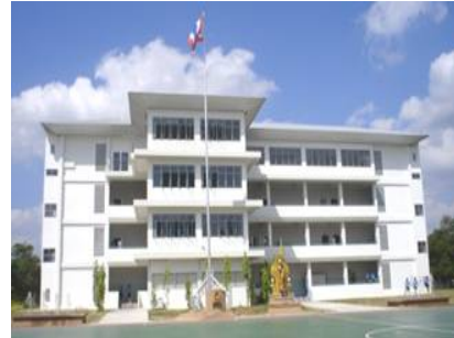
อาคารเรียน