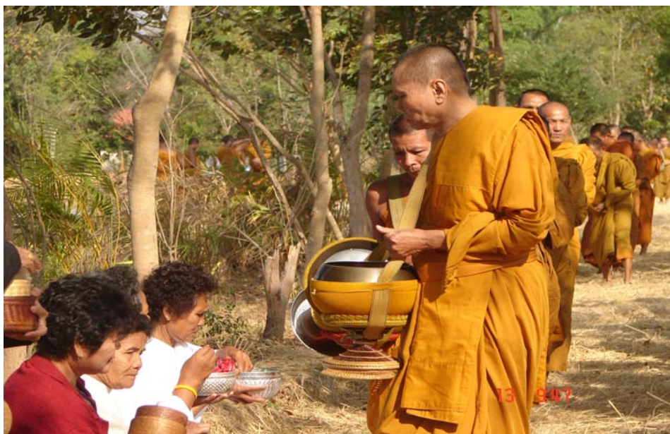
ภาพที่ ๓ (ภาพบน) พระครูพิศาลธรรมภาณีบรรยายธรรมแก่พระภิกษุผู้เข้าปรีวาสกรรม (ภาพล่าง) หลวงพ่อกำลังรับบิณฑบาตจากพุทธศาสนิกชน