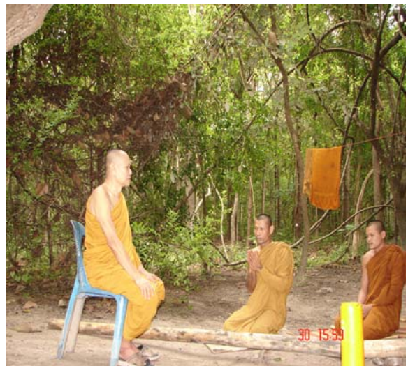
ภาพที่ ๙ พระครูพิศาลธรรมภาณีเดินจงกรมกำหนดสติ พิจารณาสติปัฏฐาน ๔ และสอบอารมณ์การปฏิบัติแก่พระสงฆ์ผู้ปฏิบัติอยู่ในป่าพุทธอุทยานบ้านเชียง