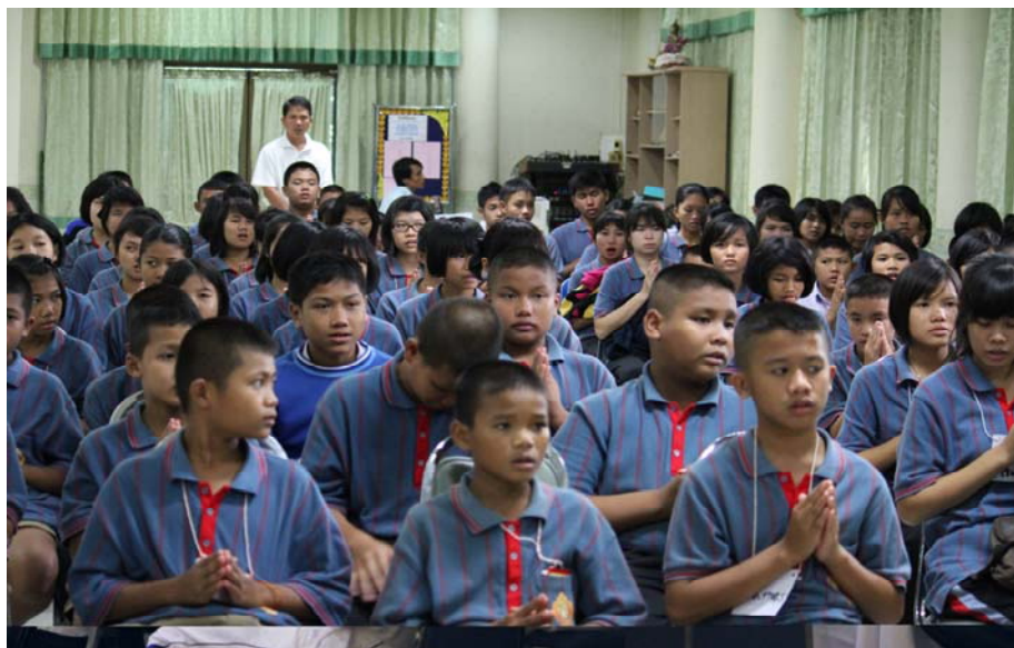
ภาพที่ ๘ โครงการอบรมเสริมทักษะชีวิตเยาวชนป้องกันและแก้ไขปัญหายาเสพติด เทศบาลวานรนิวาส จังหวัดสกลนคร