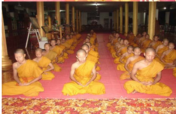
ภาพที่ ๔ งานบรรพชาสามเณรหมู่ภาคฤดูร้อนเฉลิมพระเกียรติแด่สมเด็จพระเทพรัตนราชสุดา สยามบรมราชกุมารี เพื่อฝึกฝนตนให้เป็นผู้ที่มีจิตใจที่ สะอาด สงบ สว่าง