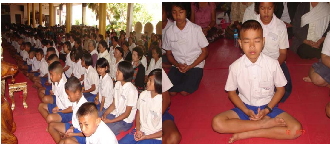
ภาพที่ ๗ อบรมเยาวชน นักเรียน เพื่อเสริมสร้างศีลธรรมในการดำเนินชีวิตที่ดีงาม